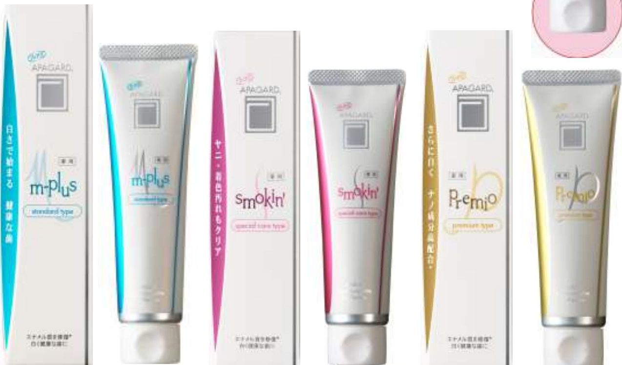
アパガードMプラス スタンダードタイプ(115g)