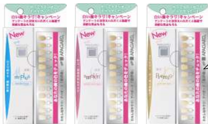
アパガードMプラス 40gトライアルセット

「歯の白さ」は人それぞれです。美白歯みがきへのさらなる興味喚起を目的とし、自分の歯の白さを比較できる“歯の色チェックカード”を同梱したスペシャルパッケージを、「アパガード40g トライアルセット」として数量限定で発売致します。