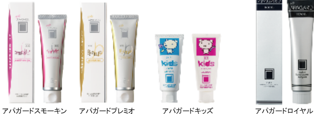
アパガードスモーキン