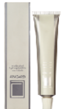
アパガード 第一号

ハイドロキシアパタイトの働きを証明する為、永年の実験や臨床検査を重ね、サンギのハイドロキシアパタイトが旧厚生省よりむし歯予防効果のある薬用成分として認可され、「薬用ハイドロキシアパタイト」となりました。