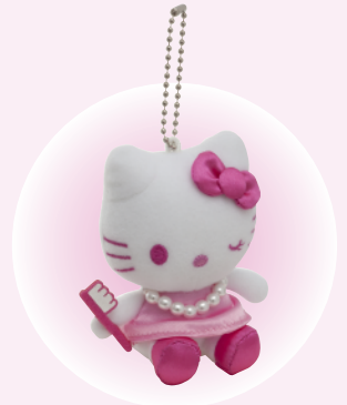
オリジナルマスコット