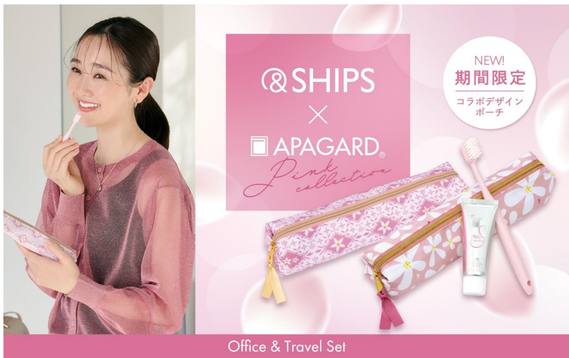
Office &amp; Travel Set

美白高機能歯みがき売上No.1*シリーズ「アパガード」などを展開する株式会社サンギ(本社:東京都中央区築地、代表取締役社長:ロズリン・ヘイマン)は、衣類や小物などを販売するセレクトショップ「SHIPS」とコラボレーションした歯みがきセット「アパガード×SHIPS オフィス&トラベルセット(セレナ)」(希望小売価格:税込880円)を2025年2月14日(金)より出荷を開始いたします。春らしい“ピンクコレクション”をテーマに、2種類を展開。全国のドラッグストアやバラエティショップ等にて販売いたします。(サンギ公式通販 https://www.sangishop.jp は2月21日(金)より発売開始)