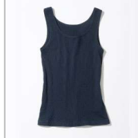
オーガニックコットン 2WAYアップタックトップ【ONE】