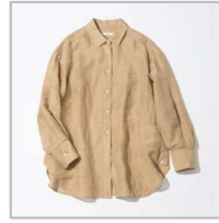
テレデラン オーバーシャツ【38】