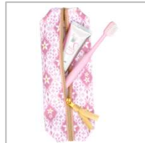
アパガード×SHIPS オフィス&トラベルセット(セレナ)オリエンタル柄