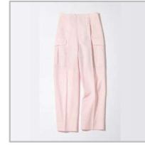
ポリエステル麻 カーゴパンツ【38】