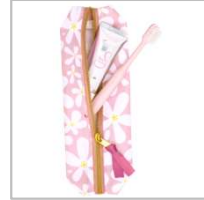
アパガード×SHIPS オフィス&トラベルセット(セレナ)花柄