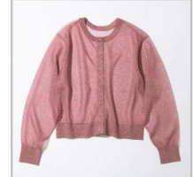
イタリーヤーン ラメショートカーディガン【ONE】