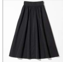
LIMONTA EAST ピンチーシタフタギャザースカート【38】