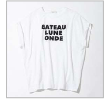
ローズベール半袖プリントTシャツ【ONE】